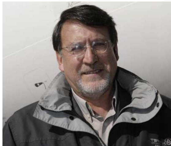
(EFE) El geógrafo y escritor Joaquín Araujo. EFE/Archivo

Alicante.- La actual crisis es el momento "ideal" para reconducir las cosas y crear "una economía ecológica, capaz de satisfacer las necesidades en un alto grado de satisfacción", según ha afirmado el geógrafo y escritor Joaquín Araujo, considerado una de las voces más respetadas en el ámbito medio ambiental.